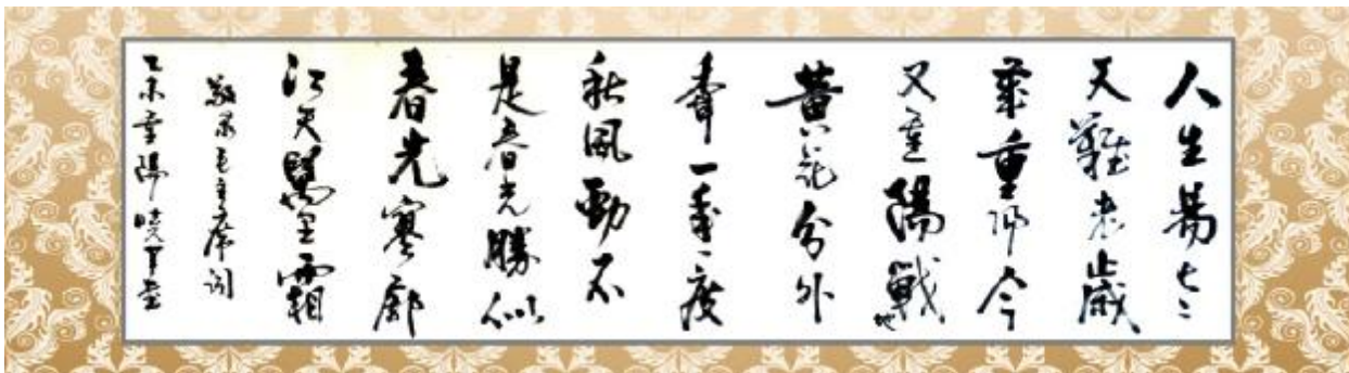
毛泽东词《采桑子·重阳》 崔晓军书于重阳